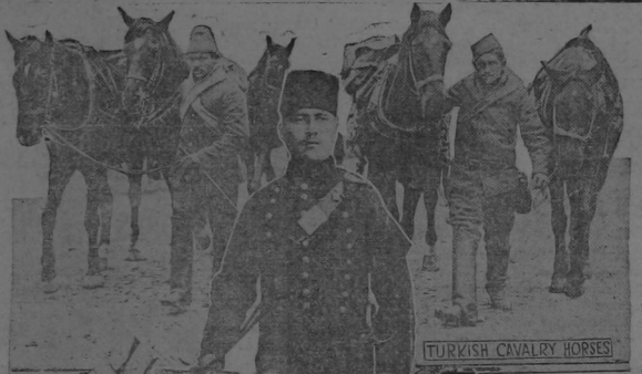
TURKISH CAVALRY HORSES