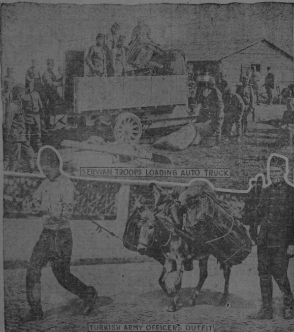
SERVIAN TROOPS LOADING AUTO TRUCK